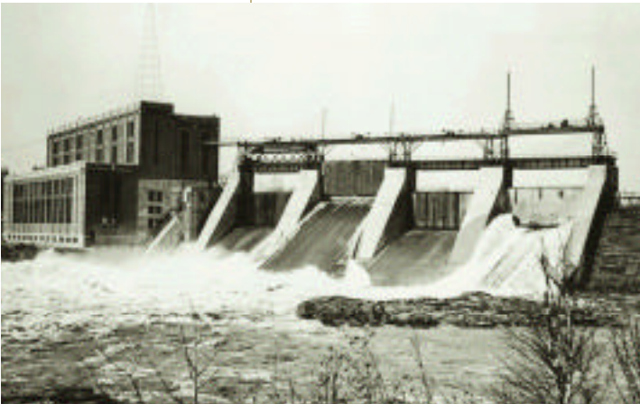
Centrale hydroélectrique de Mingins Falls à Drummondville (Québec), propriété de la société Northern Canada Power dans laquelle Power Corporation détenait une participation à sa fondation.

Son portefeuille a été concentré sur un très petit nombre de participations importantes, acquises pour le long terme, et la croissance de ces entreprises a été favorisée, à travers les années 1970 et 1980, par des gestionnaires de grande compétence bénéficiant de l'appui stratégique de l'actionnaire majoritaire. Forte d'assises financières et d'une structure solides, Power Corporation était prête à se mesurer au monde lorsque a sonné l'heure de la libéralisation des échanges et de la mondialisation dans les années 1990.