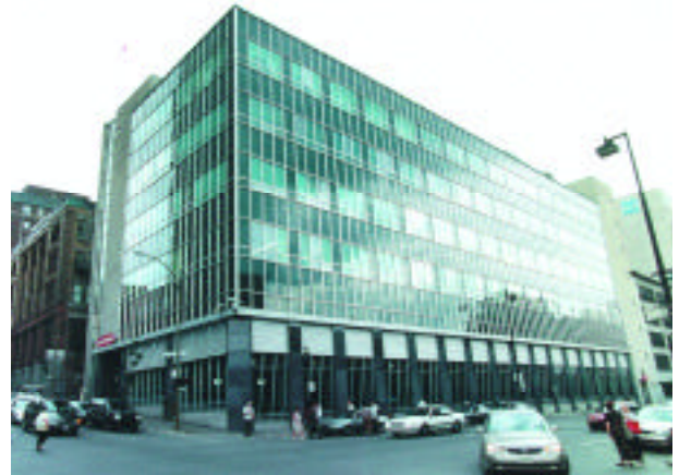
L'édifice de La Presse aujourd'hui.

Mais peu à peu, les efforts acharnés de l'équipe du siège social de Power, la grande compétence des dirigeants de ses entreprises d'exploitation et les impulsions judicieuses données par l'actionnaire majoritaire ont produit une amélioration des résultats qui a rassuré les investisseurs et relevé le cours des actions. Chez Consolidated-Bathurst, par exemple, Power a remanié l'équipe de direction, adopté une orientation stratégique vivifiante, éliminé des unités déficitaires, vendu des actifs et restructuré le bilan; de plus, cette société a réalisé un bénéfice de plus de 24 millions de dollars sur sa tentative infructueuse de prise de contrôle d'Abitibi Paper en 1974. Ses emprunts ont été remboursés et ses fonds auto-